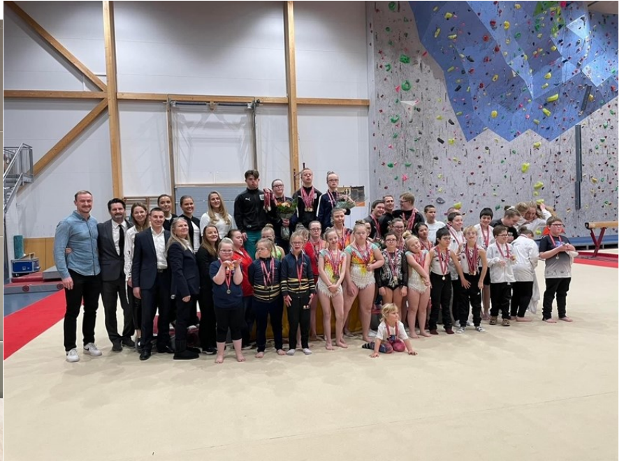
Special Olympics Nasjonal konkurranse, Elverum 18. november