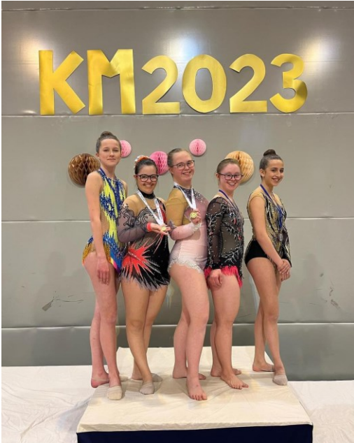
KM, Njård 6.-7. mai