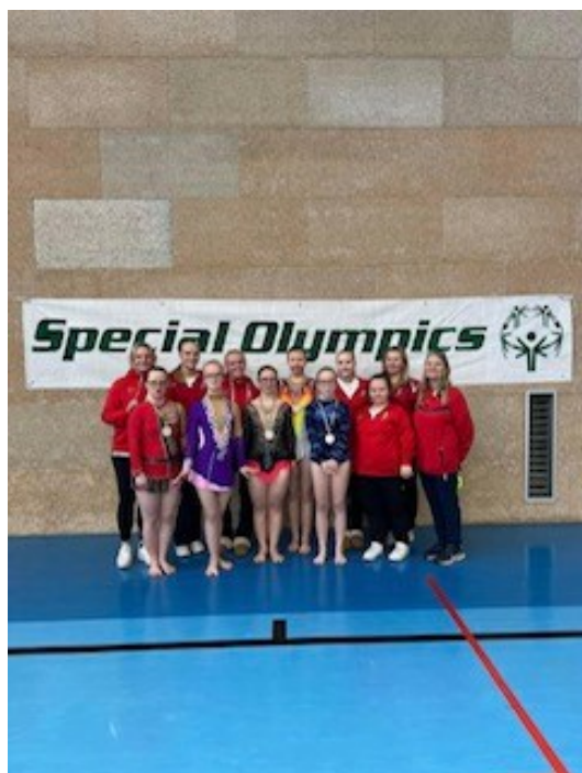
XV Zita Peratti Trophy, Genova, Italy 23.-28.11